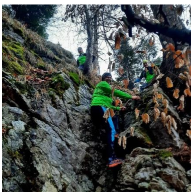
Bei einer Passage war sogar klettern gefordert

Wir auch nicht, aber unser Running-Guide HM hat die Strecke am Vortag rekognosziert und mit Hilfe von historischen Karten einen Weg gefunden, um uns ein sicheres, unvergessliches und abenteuerliches Erlebnis abseits von bekannten Wegen bieten zu können. Sogar den alten Sportplatz der Ecole d'Humanité haben wir entdeckt, was für ein Erlebnis mitten im Wald!