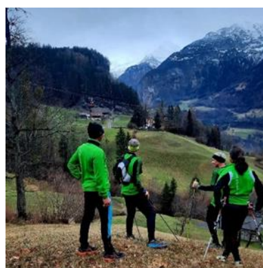
Blick von oberhalb Haselholz Richtung Schrändli